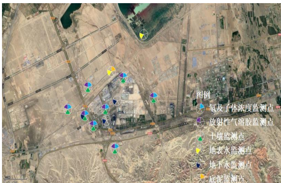
图 1 项目周边敏感目标监测取样布点图